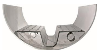
Therm-Liner Bauform A

Wir bieten, zugeschnitten auf den jeweiligen Kanal, verschiedene Therm-Liner an: