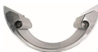
Therm-Liner Bauform B