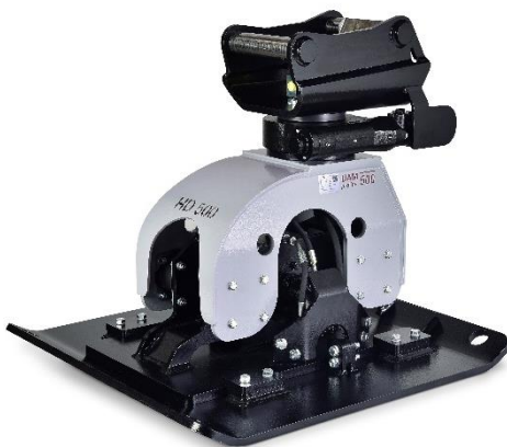
Abb. inkl. optionaler Verbreiterungsplatte

Die UAM proline Anbauverdichter erhalten ein noch umfangreicheres Einsatzgebiet durch die Verwendung von folgendem optionalem Zubehör: