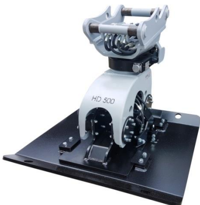
Abb. inkl. optionaler Verbreiterungsplatte

Die UAM proline Anbauverdichter erhalten ein noch umfangreicheres Einsatzgebiet durch die Verwendung von folgendem optionalem Zubehör: